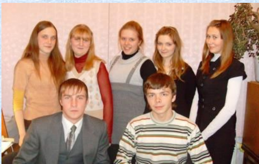
Состав МИК 2010-2012гг.

Тугулымской городской округ не стал исключением. В соответствии с постановлениями Избирательной комиссии Свердловской области от 21 октября 2010 года № 30/151 «Об утверждении Положения о молодежных избирательных комиссиях в Свердловской области», от 21 октября 2010 года № 31/161 «О Перечне и численном составе молодежных избирательных комиссий, формируемых в Свердловской области», от 21 октября 2010 года № 31/162 «О Методических рекомендациях о порядке формирования Молодежной избирательной комиссии Свердловской области, территориальных молодежных избирательных комиссий и участковых молодежных избирательных комиссий», на основании решения Тугулымской районной территориальной избирательной комиссии от 29 ноября 2010 года №16/136 был сформирован первый состав Тугулымской районной молодёжной избирательной комиссии в количестве 7 человек.