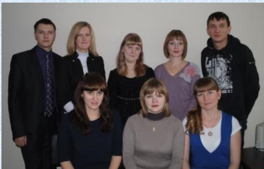
Состав МИК 2012-2014г.